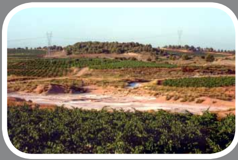
“Salinas de Jaraguas”.